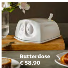
Butterdose € 58,90

Mehr Details zu den Produkten und Bestellung in unserem Online-Shop: praesent-hamburg.de