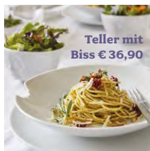
Teller mit Biss € 36,90