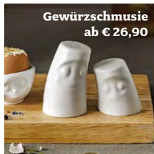
Gewürzschmusie ab € 26,90