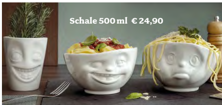
Schale 500 ml € 24,90