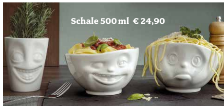
Schale 500 ml € 24,90