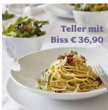
Teller mit Biss € 36,90