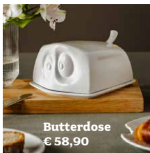
Butterdose € 58,90

Mehr Details zu den Produkten und Bestellung in unserem Online-Shop: praesent-hamburg.de