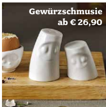
Gewürzschmusie ab € 26,90